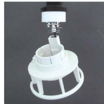
保護カバーが脱落した場合