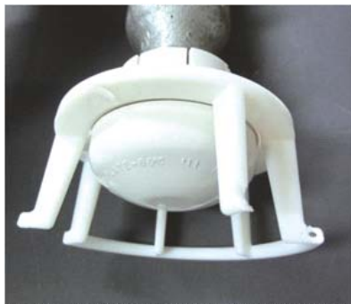
保護カバーが壊れた場合