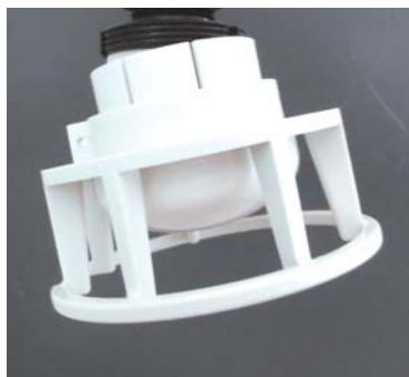
斜めにずれた場合