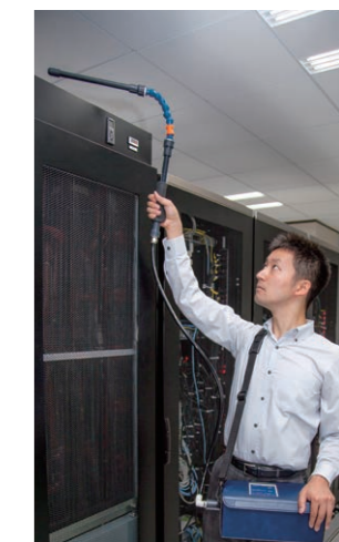
サーバールームでの使用例