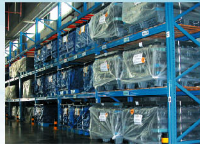
仓库、大厅等大空间