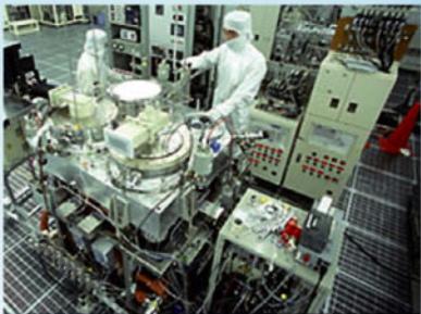
无尘室、半导体工厂等